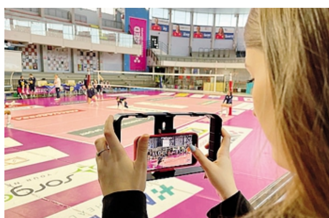
Gli studenti dell'«Oberdan» racconteranno il settore sportivo

Il tutto confluirà poi anche in un programma che verrà trasmesso su Bergamo Tv.