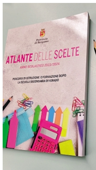
L'«Atlante delle scelte»

ma a supporto di studenti e famiglie in una scelta importante e delicata come quella della prosecuzione degli studi. «Ci sono stati anche eventi sul territorio, penso per esempio alla Fiera dell'orientamento a Treviglio, organizzata dal Comune, o all'incontro sugli Its a Boltiere - osserva il consigliere provinciale delegato alla Pianificazione scolastica, Umberto Valois -. Mi piacerebbe in futuro implementare questi ap-