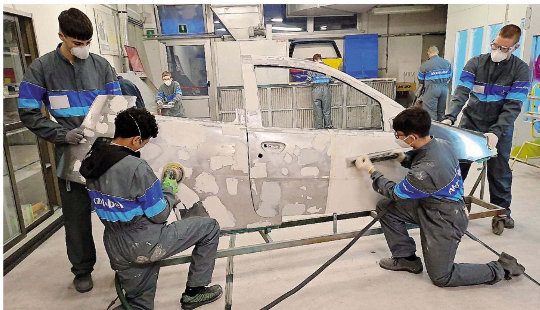
Grazie alla collaborazione tra enti formativi accreditati, scuole professionali e aziende, il sistema leFP offre percorsi triennali e quadriennali destinati ai giovani tra i 14 e i 18 anni

Tra le varie opzioni offerte dal sistema leFP, i corsi di carrozzeria riscuotono un particolare interesse. Questi percorsi formativi preparano i giovani a lavorare in un settore altamente tecnico, dove la manualità si unisce all'uso di tecnologie avanzate. Durante il corso, gli studenti apprendono com-