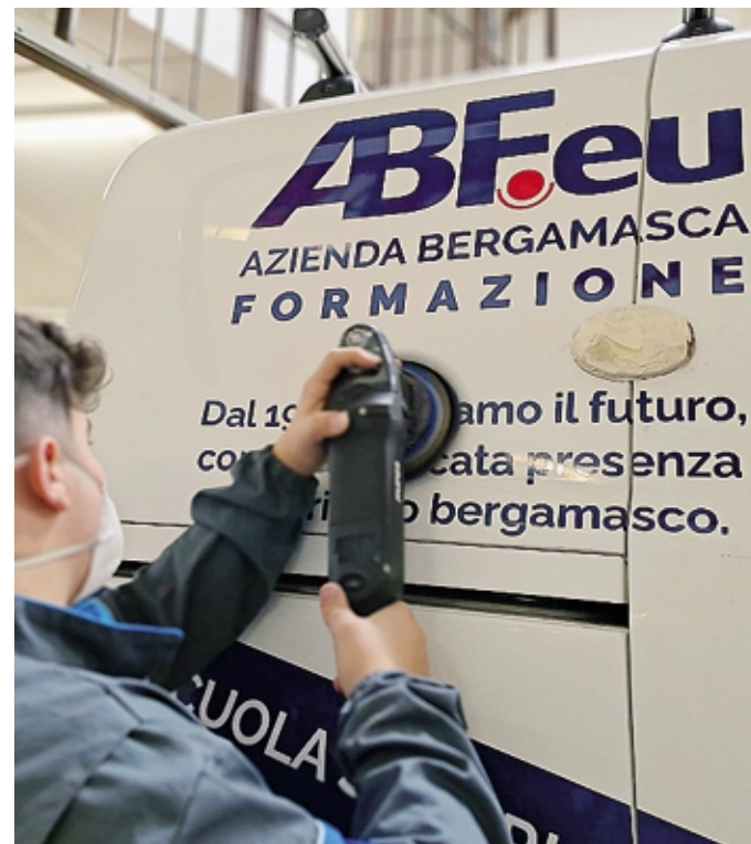
L'esperienza al Ford Campus