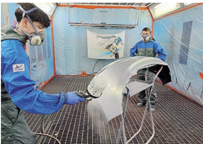
I corsi nelle sedi di Curno e Trescore Balneario offrono un programma che combina l'apprendimento pratico con una solida formazione teorica

Nell'ambito della formazione professionale provinciale, Azienda Bergamasca Formazione (ABF) si distingue per l'offerta di un percorso formativo di eccellenza dedicato al settore della carrozzeria automobilistica. Con una durata triennale, estendibile ad un quarto anno per il conseguimento del diploma di Tecnico, questo corso rappresenta una solida base per i giovani appassionati di motori, interessati a entrare nel mondo del lavoro con competenze certificate a livello europeo.