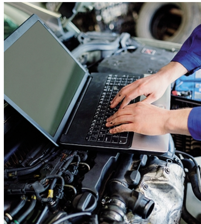
Il corso offre la possibilità di proseguire con un quarto anno