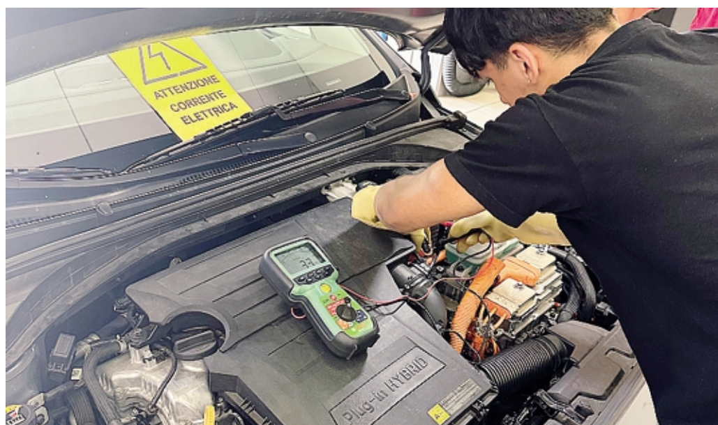
Il progetto nasce dalla collaborazione strategica con Fondazione ITS Move Academy

Attraverso il sistema duale, che alterna studio e lavoro retribuito, gli studenti sviluppano una professionalità immediatamente spendibile. Acquisiscono competenze specifiche nella gestione dei veicoli ibridi ed elettrici, nonché nella manutenzione dei moderni sistemi di assistenza alla guida (ADAS) e di sicurezza attiva e passiva. La sinergia tra l'ente di formazione e le officine del territorio permette di allineare i programmi didattici alle reali necessità del mercato. Ciò garantisce alle imprese l'inserimento di personale giovanegia orientato alle dinamiche lavorative, offrendo contestualmente ai ragazzi una prospettiva occupazionale definita in un settore in forte espansione.