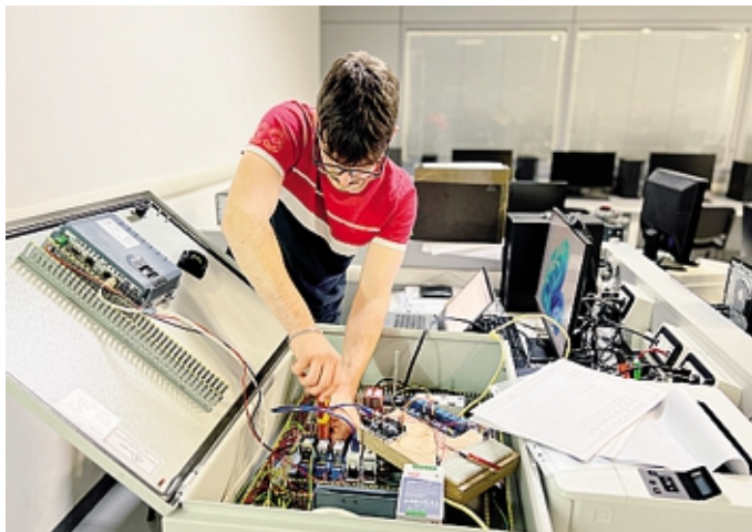
Fino a gennaio ABF propone un calendario di open day e mini stage

Il tirocinio curricolare costituisce il primo reale contatto con le dinamiche aziendali: permette ai ragazzi di misurarsi con responsabilità, tempi e regole che governano il mondo del lavoro. Attraverso la collaborazione con una vasta rete di imprese locali, ABF garanti-