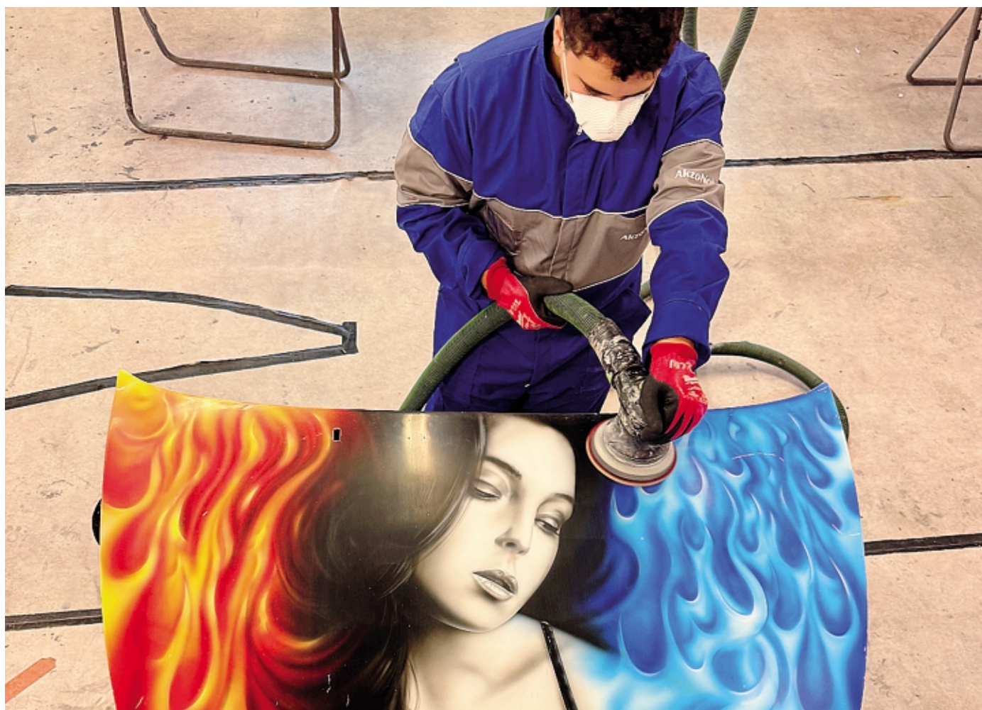
Il corso presso le sedi di Curno e Trescore Balneario dove sono presenti laboratori per simulare le dinamiche operative di una reale officina

L'offerta formativa di Azienda Bergamasca Formazione nel settore automotive si conferma un elemento centrale anche per il prossimo anno formativo. Il percorso dedicato alla carrozzeria mira a fornire ai giovani in uscita dalla scuola secondaria di primo grado tutte le competenze necessarie per operare con professionalità nella riparazione di veicoli. Il corso si sviluppa su base triennale, con la possibilità di proseguire per un quarto anno e conseguire il diploma professionale di tecnico. Il progetto didattico è studiato per trasferire agli allievi conoscenze tecniche e pratiche immediatamente spendibili nel mercato del lavoro, mantenendo però un forte focus sulla formazione di base.